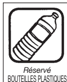
Réservé BOUTEILLES PLASTIQUES Bouteilles plastiques et "briques" Aérosols - Boîtes métalliques boîtes de conserve

Tous les textiles et chaussures usagés, vêtements, linges de maison (tout tissu) bien emballés hermétiquement. Le Secours Catholique rue de la Gare est aussi un point de dépôt.