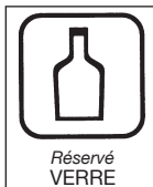
Réservé VERRE Verre d'emballage uniquement (pas de verre)

Ils sont accessibles en journée. Conteneurs mis à votre disposition pour le tri sélectif :